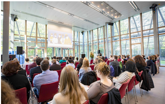
Fachtagung in der Landesvertretung Berlin am 21. September 2022

Seit Beginn der Corona-Pandemie wird Antisemitismus immer wieder offen zur Schau gestellt: Auf Demonstrationen werden Opfer der Shoah verhöhnt und Verschwörungstheorien verbreitet. Sicherheitsbehörden und zivilgesellschaftliche Organisationen verzeichnen schon lange einen alarmierenden Anstieg antisemitischer Taten. Die Erscheinungsformen und Tatorte sind vielfältig: Sie reichen von Propagandadelikten im öffentlichen Raum und Hate Speech im Internet über Anschläge auf