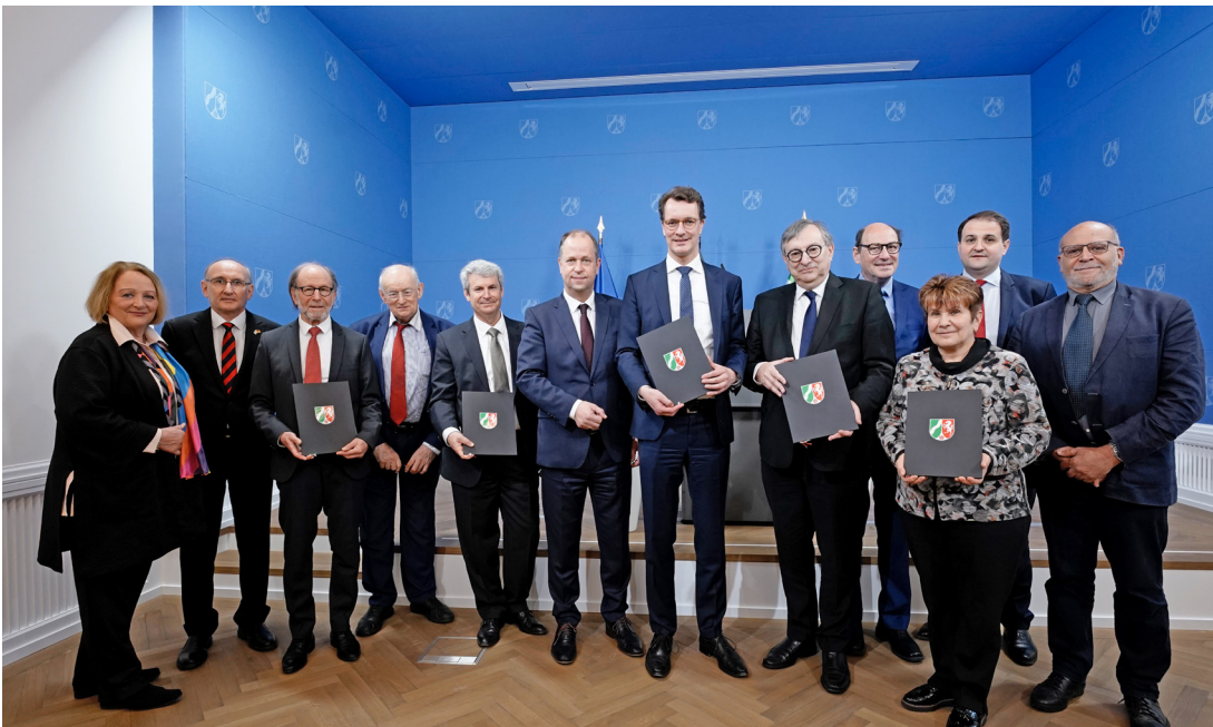
Vertragsunterzeichnung des Sechsten Änderungsstaatsvertrags zwischen den Jüdischen Landesverbänden und dem Land Nordrhein-Westfalen

Kurz nach dem Anschlag auf die Alte Synagoge wurden die Sicherheitsvorkehrungen an den Synagogen und jüdischen Einrichtungen in Nordrhein-Westfalen überprüft. Im Bedarfsfall verstärkte die Polizei den Streifendienst und setzte weitere Sicherheitsmaßnahmen zügig um. 41 Erkenntnisse hinsichtlich eines möglichen unmittelbar bevorstehenden Anschlags gegen jüdische Einrichtungen oder andere Gotteshäuser liegen den Sicherheitsbehörden aktuell nicht vor. Jedoch ist im Allgemeinen weiterhin von einer hohen abstrakten Gefährdungslage auszugehen. 42