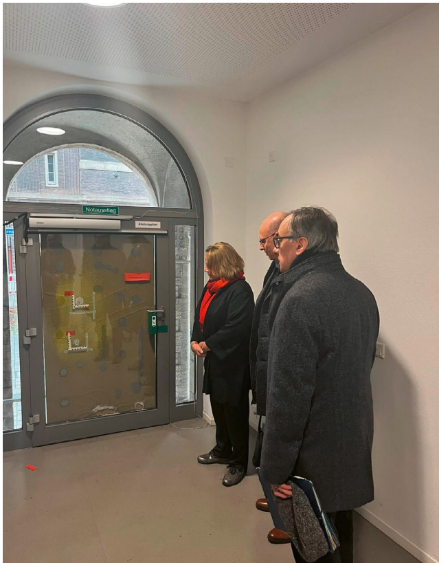
Tür des alten Rabbinerhaus in Essen am 29. November 2022

Steinheim-Institut für deutsch-jüdische Geschichte sowie Räume der Universität Duisburg-Essen untergebracht. 35 Obwohl die Räumlichkeiten der Alten Synagoge von der jüdischen Gemeinde Essen lediglich zu besonderen Anlässen genutzt werden, stellt die Alte Synagoge ein wichtiges Symbol für das jüdische Leben in Deutschland dar. Die unmittelbaren Reaktionen der Sicherheitsbehörden haben diesem Umstand Rechnung getragen und gezeigt, dass hier der Kontext richtig eingeordnet wurde. Daher war und ist es unerlässlich, dass sich, nach Bekanntwerden des Anschlags, alle Behörden auf allen Ebenen schnell austauschten und abgestimmt haben. Der Generalbundesanwalt beim Bundesgerichtshof (Generalbundesanwalt) hat in Gänze die Ermittlungen am 02. Dezember 2022 übernommen. 36 Über die Schüsse auf das Rabbinerhaus hinaus gab es in einem engen zeitlichen Zusammenhang noch weitere Anschläge mit antisemitischem Hintergrund im Ruhrgebiet. 37 Eine lückenlose Aufklärung zu den Angreifern und Hintergründen der Tat ist unerlässlich.