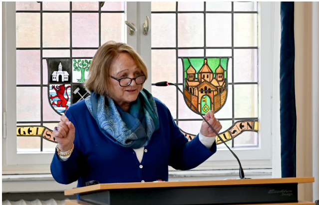
Sabine Leutheusser-Schnarrenberger bei der Kommunaltagung am 7. Dezember 2022 in der Bezirksregierung Münster

der Servicestelle für Antidiskriminierungsarbeit mit dem Schwerpunkt Antisemitismus. Sie bietet Beratung für Betroffene von Antisemitismus und Diskriminierung in der Region Westfalen Lippe sowie anlassbezogene Fachberatung bei antisemitischen Vorfällen an.