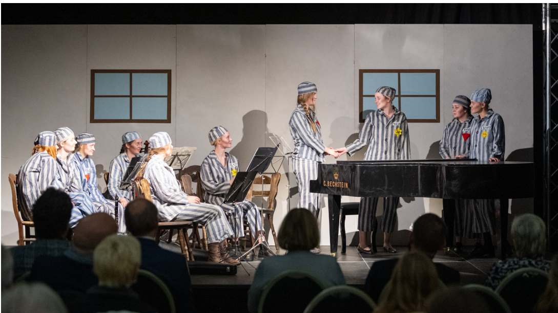
Aufführung Junges Ensemble Mariengarden – Zeitspiel

Das Theaterstück bringt den Zuschauerinnen und Zuschauern den Alltag im KZ sehr nahe und berührt auf persönlicher Ebene. Es gibt einen Einblick in das Leben dieser 13 bis 20 Jahre alten jungen Frauen und ruft die Grausamkeit des Nationalsozialismus ins Gedächtnis. Es berührt damit insbesondere seine jugendlichen Zuschauerinnen und Zuschauer.