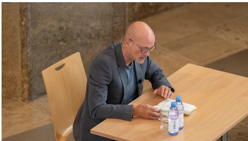
Schauspieler und Autor Christian Berkel liest aus seinem Roman „Der Apfelbaum“.

Die Nachfrage war bei allen Veranstaltungen sehr groß und es konnten mehrere Hundert Menschen erreicht werden, die so für das Thema sensibilisiert wurden. Christian Berkel las aus seinem Erstlingswerk „Der Apfelbaum“, Andrea Sawatzki aus dem Roman „Der Reisende“ von Ulrich Alexander Boschwitz und Benno Fürmann aus „Fritz Bauer – oder Auschwitz vor Gericht“ von Ronen Steinke.