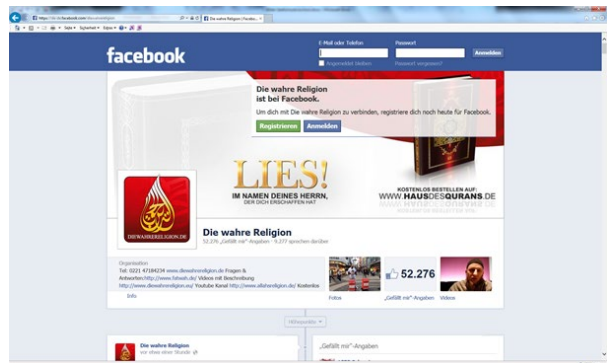
Beispiel einer Facebook-Seite mit salafistischen Inhalten

Das Internet bietet insbesondere in sozialen Netzwerken und Videoportalen gute Möglichkeiten, salafistische Propaganda leicht verfügbar und verführend aufbereitet zu präsentieren. Junge Menschen werden dort erreicht, wo sie mittlerweile einen sehr großen Teil ihrer Zeit verbringen.