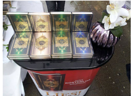
Beispiel für einen salafistischen Informationsstand

Mit religiösem Informationsmaterial gehen Salafisten gezielt auf Menschen zu. Ein Beispiel hierfür sind die unter „Markenzeichen“ von salafistischen Netzwerken verteilten Koranexemplare. Problematisch ist in diesem Zusammenhang nicht der Koran selbst, sondern die mobilisierende Wirkung durch die Verteilergruppen. Die Religionsfreiheit wird offensiv ausgenutzt.