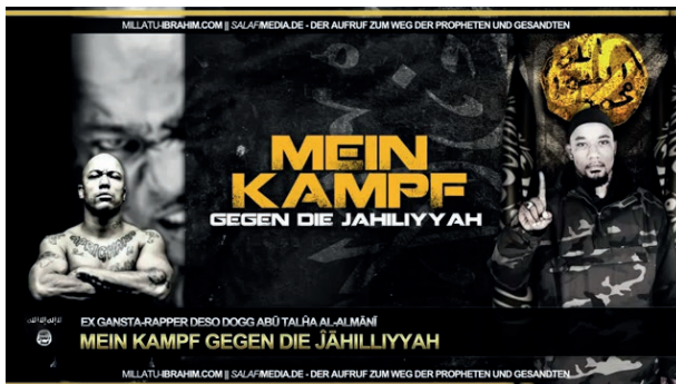
Selbstdarstellung eines deutschen Salafisten im Internet (Jahiliyyah = Unwissenheit)

Gleichzeitig schüchtern die plastischen Warnungen salafistischer Prediger vor der Hölle junge Menschen ein und machen sie manipulierbar.