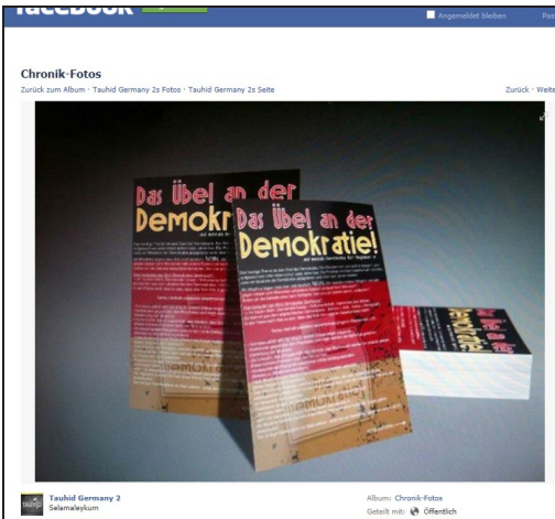
Werbung mit demokratiefeindlichen Flyern im Internet

Alle Muslime berufen sich in ihrer religiösen Überzeugung auf den Koran und die Vorbildfunktion des Propheten Muhammad (die sogenannte „Sunnah“).