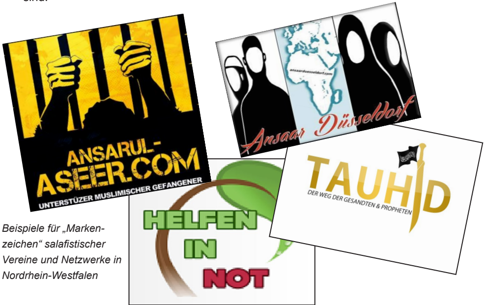
Beispiele für „Markenzeichen“ salafistischer Vereine und Netzwerke in Nordrhein-Westfalen

Nordrhein-Westfalen ist das bevölkerungsreichste Bundesland mit einer stark von Industrie geprägten Wirtschaft. Es hat in den letzten Jahrzehnten rund ein Drittel aller Personen aufgenommen, die bundesweit aus muslimischen Ländern eingewandert sind.