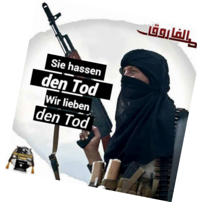
Deutschsprachige pro-jihadistische Propaganda im Syrienkonflikt