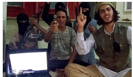
Deutschsprachige Drohvideos im Internet

Salafisten weichen für geschlossene Veranstaltungen wie beispielsweise Islamseminare und Gebete oftmals in Wohnräume und privat angemietete Räumlichkeiten aus. Das Auftreten in „klassischen“ Moscheen sowie „Hinterhof-Moscheen“ ist für Salafisten aufgrund des öffentlichen Drucks mittlerweile mit großen Schwierigkeiten verbunden.