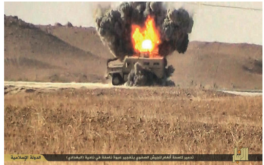
Jihadistische Propaganda aus Syrien in sozialen Netzwerken: Twitter

Bedeutende Entwicklungen im Nahen Osten wie beispielsweise der arabische Frühling und die Syrienkrise wirken sich auch immer auf die Diskurse und Konzepte salafistischer Szenen in Nordrhein-Westfalen aus. Konkrete Anknüpfungspunkte können dabei zum Beispiel Ideen einer aktiven Teilhabe am politischen System etwa in Ägypten die Etablierung salafistischer Parteien oder die Gründung neuer salafistischer al-Qaida-Ableger zum Beispiel aus Anlass des Bürgerkrieges in Syrien sein.