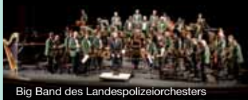
Big Band des Landespolizeiorchesters