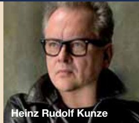
Heinz Rudolf Kunze