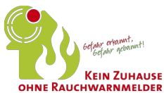
Abbildung S. 15: Fotolia