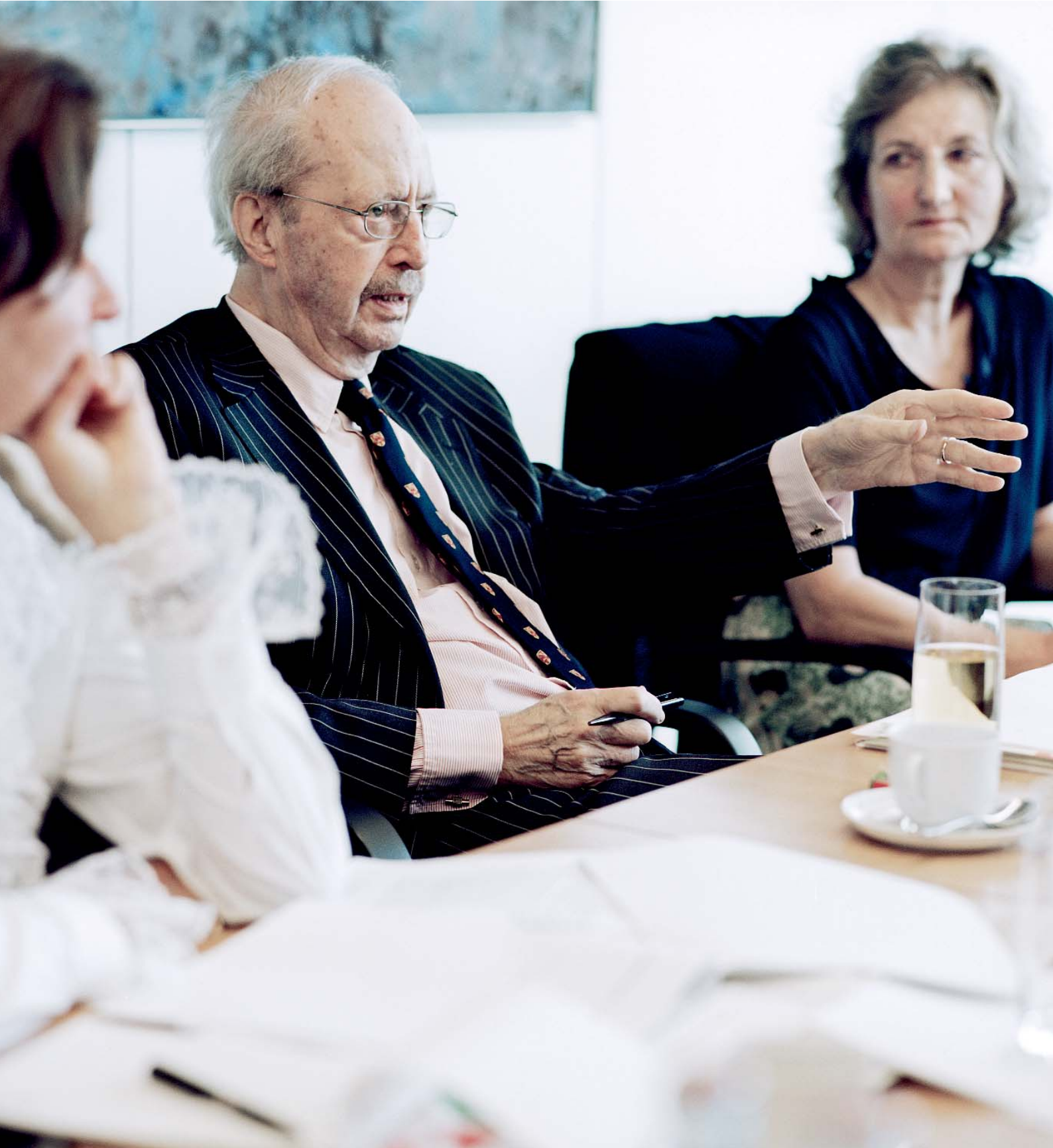
Lord Ralf Dahrendorf